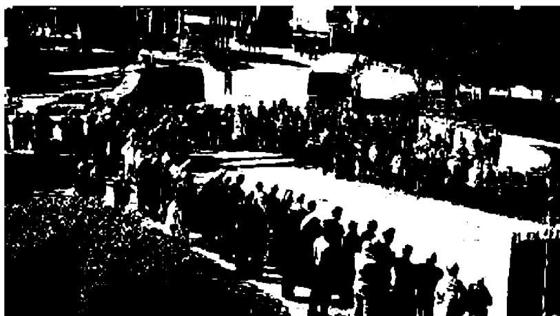
I presenti alla cerimonia di ieri a Longarone