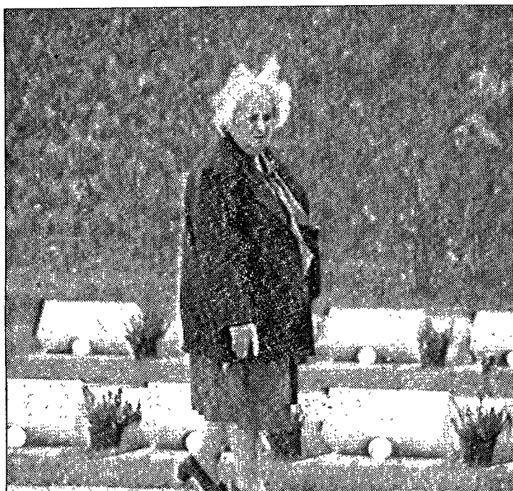
LA MEMORIA Il cimitero monumentale a Fortogna di Longarone