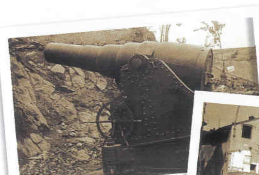
Prima Guerra Mondiale Fronte Italiano

telefono 0424 217800 | info@museobassano.it