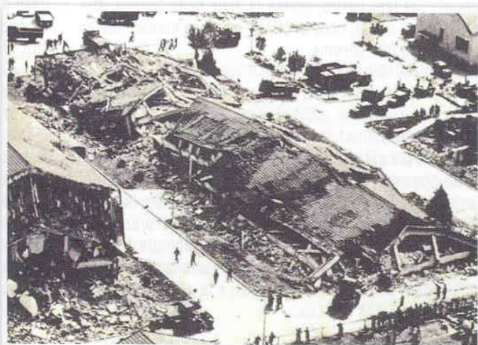
Caserma Goi - Pantanali - Gemona

Alle ore 20,59 di giovedì 6 maggio 1976, un terremoto di eccezionale intensità sconvolse il Friuli. Quasi mille le vittime, 400 delle quali a Gemona, migliaia i feriti, numerosi i comuni colpiti, per un raggio di 60 km dall'epicentro. La scossa durò una cinquantina di secondi